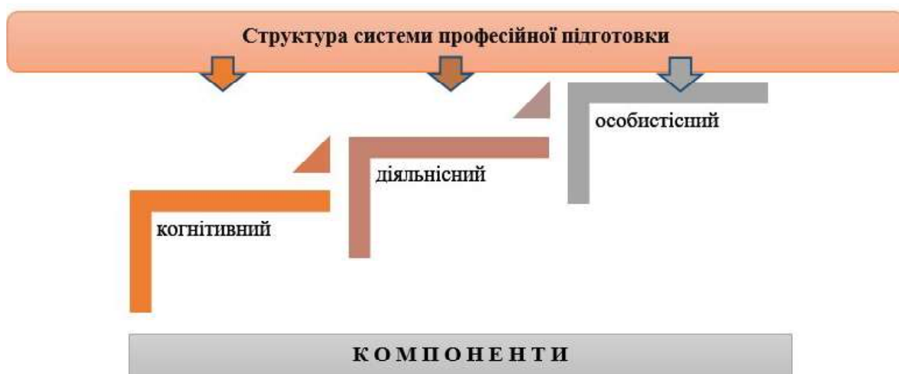
Рис. 1. Структура системи професійної підготовки

Сфокусуємо увагу на структурі системи професійної підготовки, яка у найбільш класичних варіаціях представлена когнітивним, діяльнісним і особистісним компонентами, взаємодія яких забезпечує якісну фахову підготовку здобувачів та формування в них готовності до реалізації професійної діяльності (Potapiuk, 2020). (див. рис. 1).