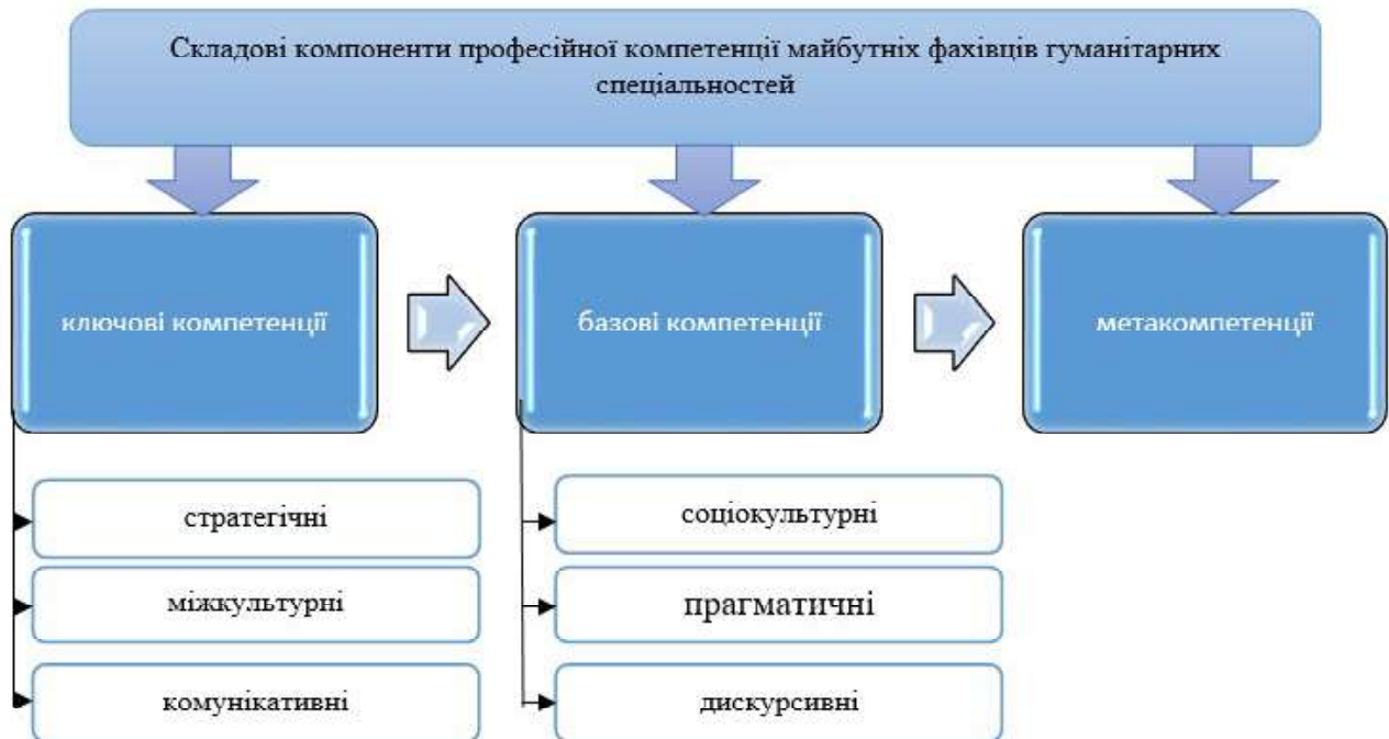
Рис. 3. Складові компоненти професійної компетенції майбутніх фахівців гуманітарних спеціальностей

відображає вміння та навички спілкування у цифровому середовищі, зокрема, спілкування у соціальних мережах, форумах і чатах, ведення ділової переписки, сприймання інформації у мультимедійному форматі.